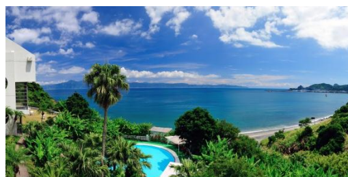
■ 目の前に海が広がる「指宿ロイヤルホテル」からの眺め