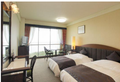
■ オーシャンビューの客室