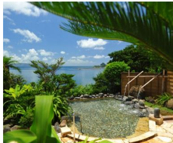
■ 古毛曾湯（こもそゆ）