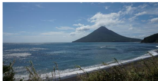
■ 指宿の薩摩富士と呼ばれる「開聞岳」